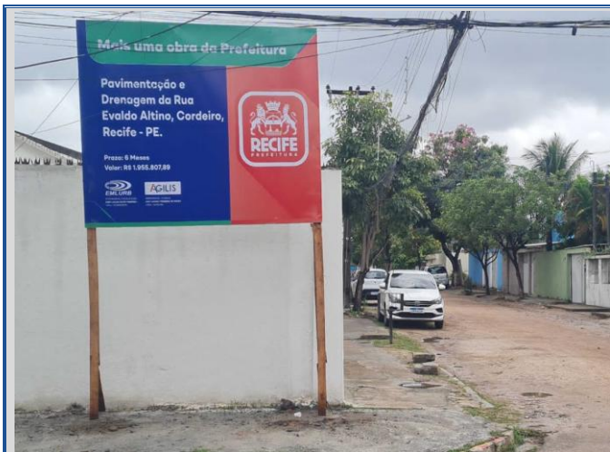
Obra: Placa de Obra da Rua Professor Evaldo Altino.