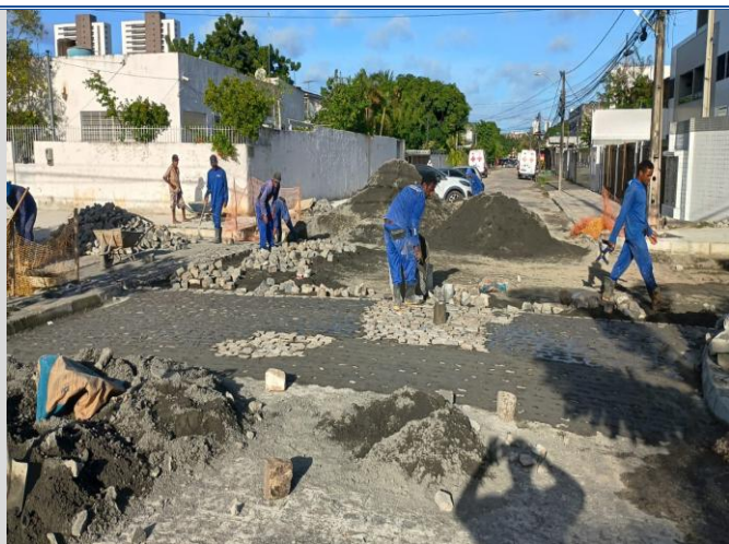
Obra: Execução da Rua Professor Evaldo Altino.