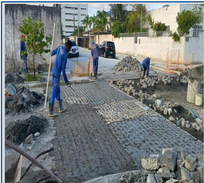
Obra: Execução da Rua Professor Evaldo Altino.