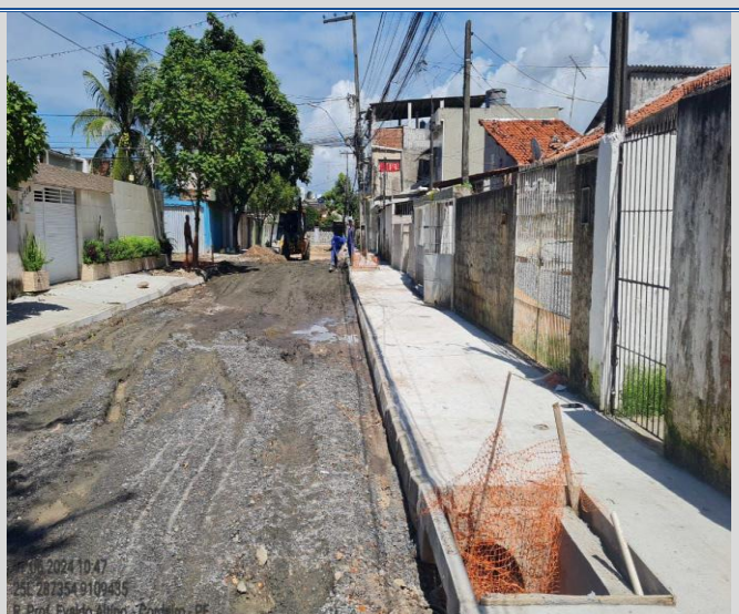
Obra: Execução da Rua Professor Evaldo Altino.