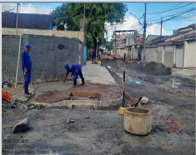
Obra: Execução da Rua Professor Evaldo Altino.