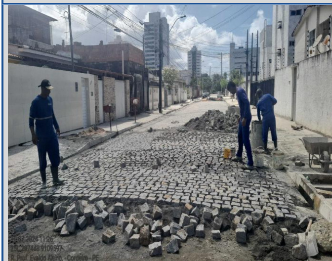
Obra: Execução da Rua Professor Evaldo Altino.