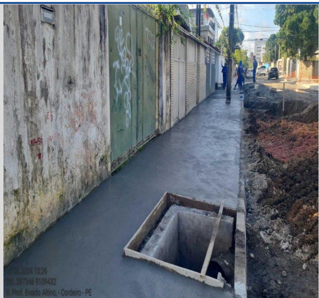
Obra: Execução da Rua Professor Evaldo Altino.