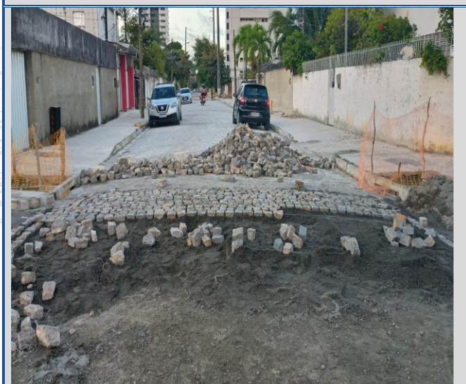
Obra: Execução da Rua Professor Evaldo Altino.